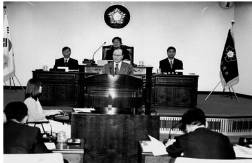
본회의 집행부업무보고 청취

시장, 위원회, 또는 의원 1/5 이상이 발의한 의안이 있을 때 소집하여 해당사항을 심사한다. 임시회의의 일수에 포함한다.